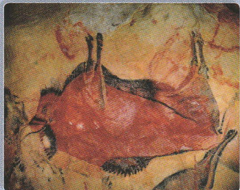
Malba z pravěké jeskyně Altamira ve Španělsku